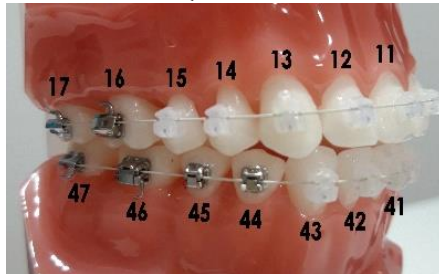
Elastique à droite